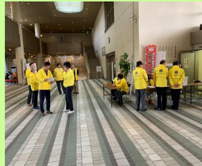
設営風景です。参加されたメンバーの皆様お疲れ様でした。