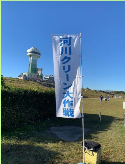
川と海のクリーン大作戦