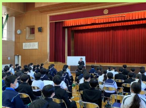
江南市立西部中学校 校長先生の挨拶