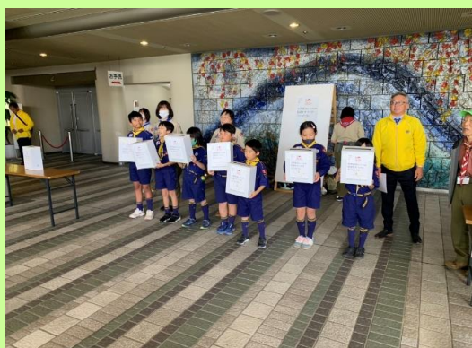
名古屋小児がん基金募金総額 ¥156,272