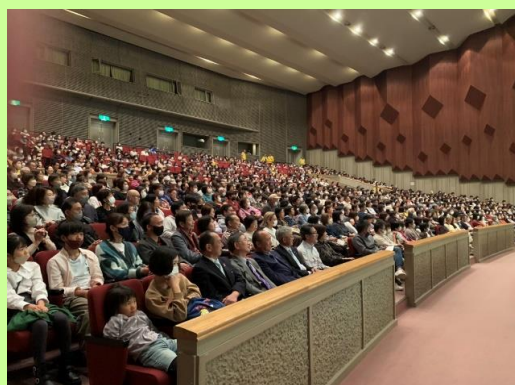
会場の席を埋め尽くす大盛況