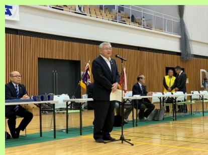
来賓祝辞 江南市教育委員会教育長 村 良弘 様