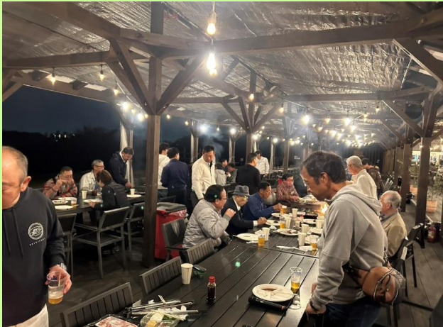
懇親会の風景です。