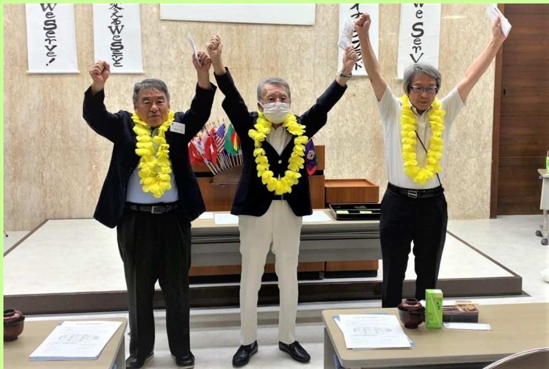
お誕生日おめでとうございます。