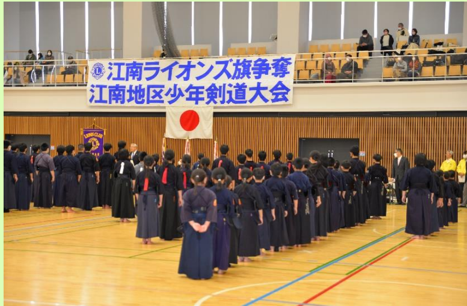
開会式の様子 175名の剣士が試合に参加しました。