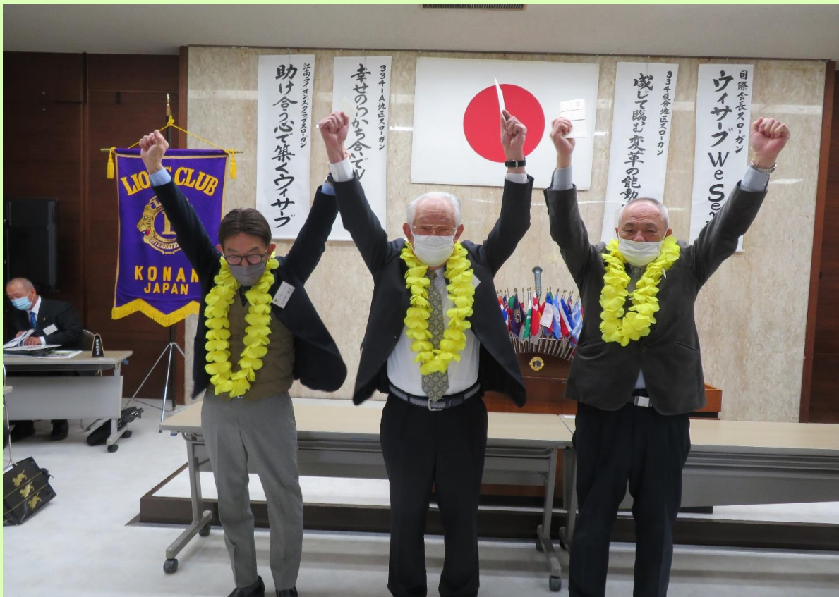
3月ご結婚記念日おめでとうございます。