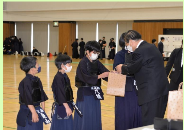
新入会員へ記念品が贈られました。