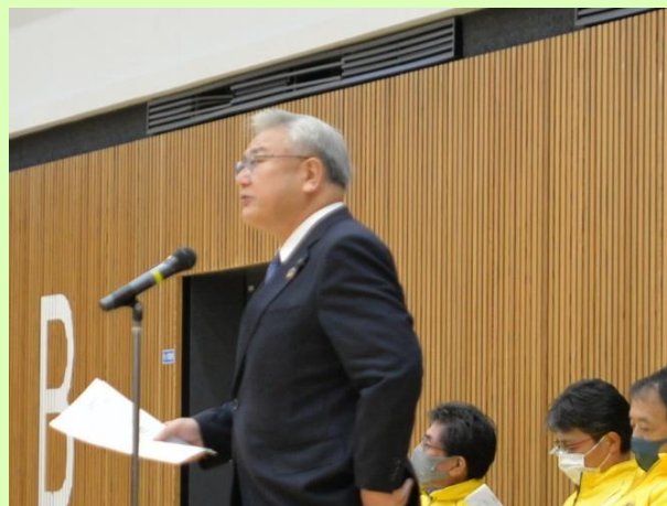
来賓祝辞 江南市教育委員会教育長 村 良弘 様