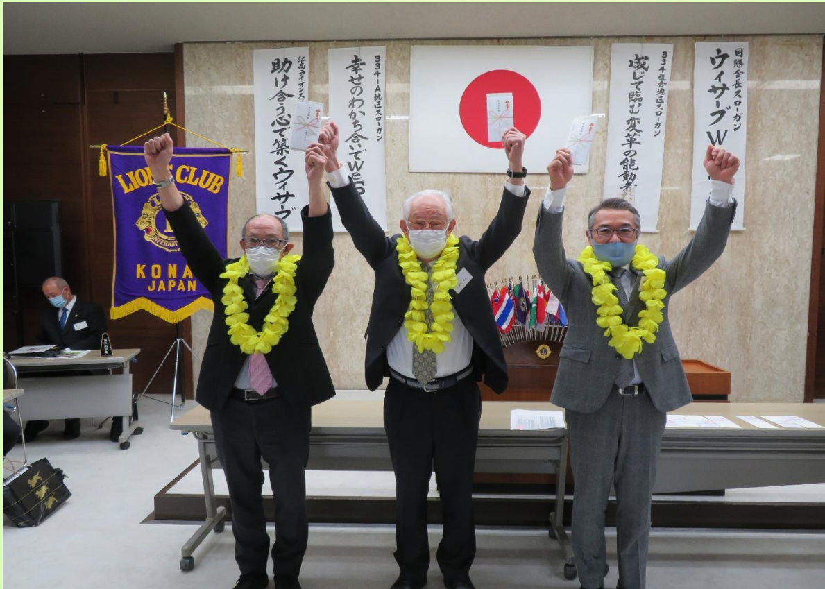
3月お誕生日おめでとうございます。