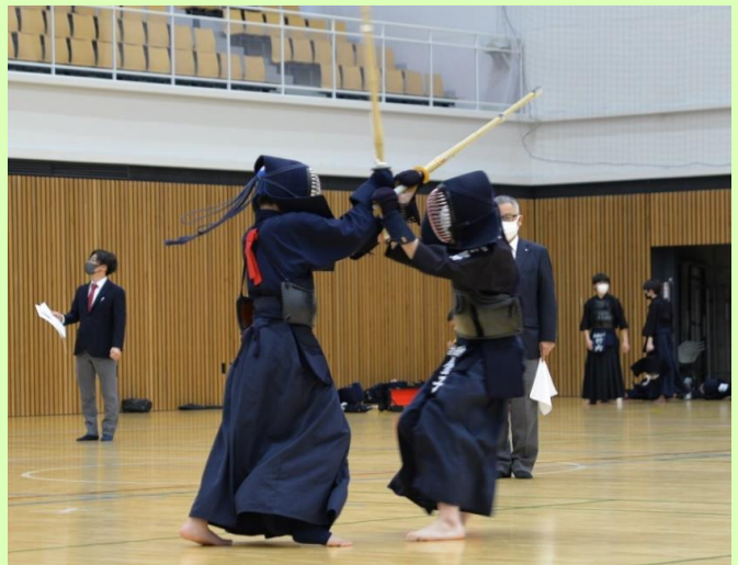
白熱した戦いが繰り広げられました。