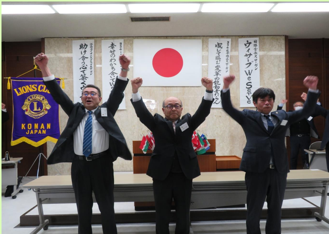
スピーチをしていただいた次期三役のライオンズローア