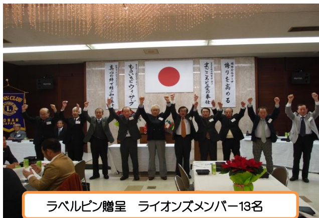
ラベルピン贈呈 ライオンズメンバー13名