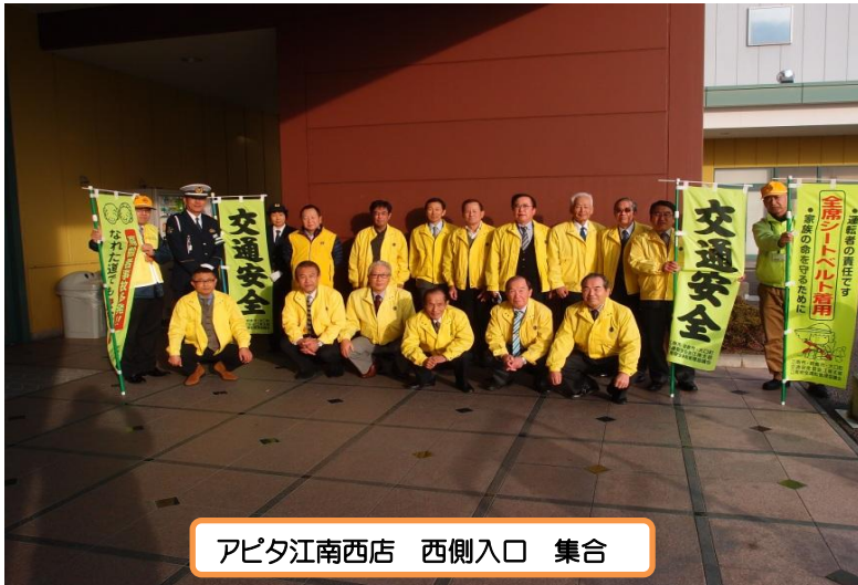
アピタ江南西店 西側入口 集合