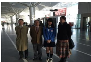
中部国際空港 YCE派遣生 出発!