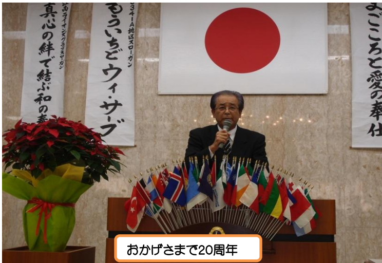
おかげさまで20周年