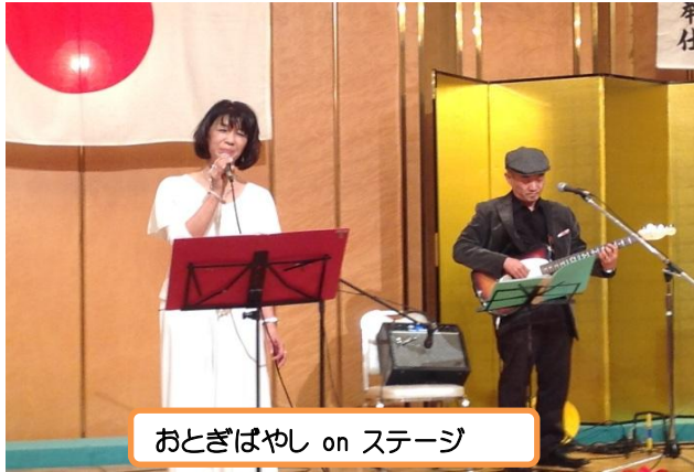
おとぎばやし on ステージ