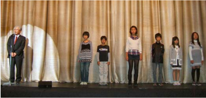
国際平和ポスター表彰